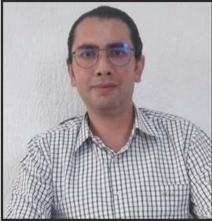
Toluca / Estado de México

C on cada minuto se acerca más el momento en que los partidos habrán de decidir quién será el candidato que buscará la gubernatura del Estado de México, ante esto todos los personajes políticos tiene un papel fundamental en la selección y obviamente en el triunfo de quien encabezará los caminos del territorio mexiquense.