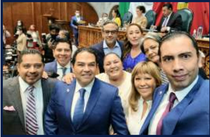
Huixquilucan / Estado de México

E l grupo parlamentario del Partido Acción Nacional (PAN), en el estado de México, en voz del diputado de la LXI legislatura, Román Cortés, presentó la iniciativa de reforma para agilizar trámites administrativos para la apertura de empresas micro y medianas, con ello pretenden incentivar y reactivar la economía del Estado de México.