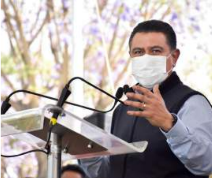
Tlalnepantla / Estado de México

P ara reforzar la seguridad en el municipio y brindar mejores condiciones de vida, el Presidente de Tlalnepantla hace la entrega de 175 patrullas en total; 140 radio patrullas y 35 motos patrullas, así como la redistribución de armamento nuevo; 53 armas largas y 62 cortas, dando un total de 115 armas, equipo que se sumará a las labores de vigilancia en los sectores y comunidades que tienen los índices más altos de violencia.