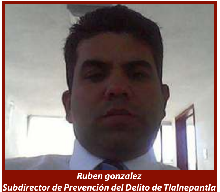
Ruben Gonzalez Subdirector de Prevención del Delito de Tlalnepantla

A la mujer en condición de violencia se le dio acompañamiento para realizar la denuncia correspondiente ante la Fiscalía Especializada en Violencia Familiar, Sexual y de Género, se le brindaron los números de emergencia. En otras acciones, policías municipales acudieron a los domicilios de cuatro ciudadanas en condición de violencia para entregar medidas de protección emitidas por autoridades estatales, también les proporcionaron los números de emergencia en caso de ser necesario.