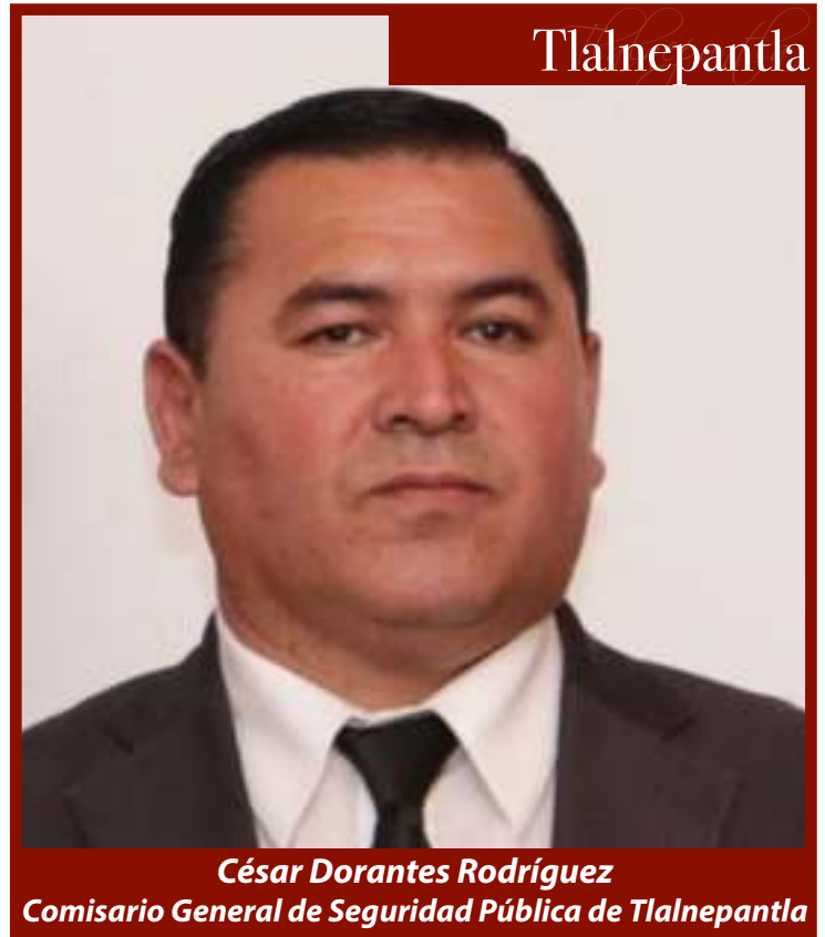
César Dorantes Rodríguez Comisario General de Seguridad Pública de Tlalnepantla

A la mujer en condición de violencia se le dio acompañamiento para realizar la denuncia correspondiente ante la Fiscalía Especializada en Violencia Familiar, Sexual y de Género, se le brindaron los números de emergencia. En otras acciones, policías municipales acudieron a los domicilios de cuatro ciudadanas en condición de violencia para entregar medidas de protección emitidas por autoridades estatales, también les proporcionaron los números de emergencia en caso de ser necesario.