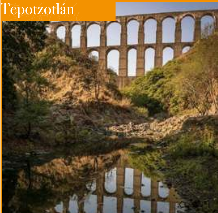
Los Arcos del Sitio monumento emblemático que ha dado identidad al municipio de Tepotzotlán.