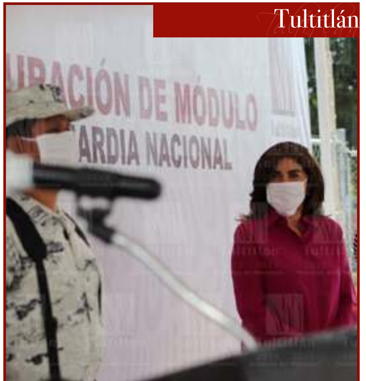
En la Zona Oriente de Tultitlán cuentan con una base de la Guardia Nacional que velará por la seguridad de los habitantes.

Hizo mención en que seguirá los pasos del Presidente de la República, el Lic. Andrés Manuel López Obrador, para