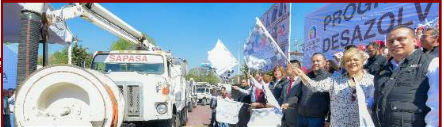
La Presidenta Municipal de Atizapán dio el banderazo de inicio al Programa de Limpieza y Desazolve Municipal 2020.