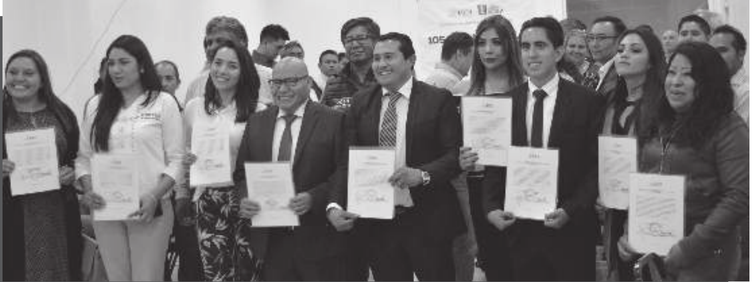
El documento que recibió el candidato de la coalición "Juntos Haremos Historia" lo avala como Alcalde para el periodo 2019-2021.