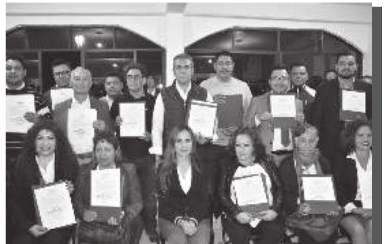
Integrantes de la planilla del próximo gobierno de Ecatepec se les entregó su constancia de mayoría.

Por tal motivo invitó a los actores políticos a sumarse al proyecto de un mejor Ecatepec, aceptando los resultados que ratificó el IEEM y es el momento de comenzar a trabajar por un mismo objetivo; de igual forma agradeció la confianza de la población a quienes les reiteró no les va a fallar.