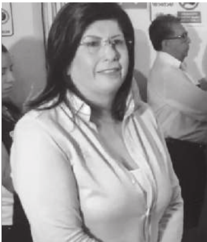
Mariela Gutiérrez Escalante recibió su constancia que la avala como Alcaldesa del municipio de Tecámac.