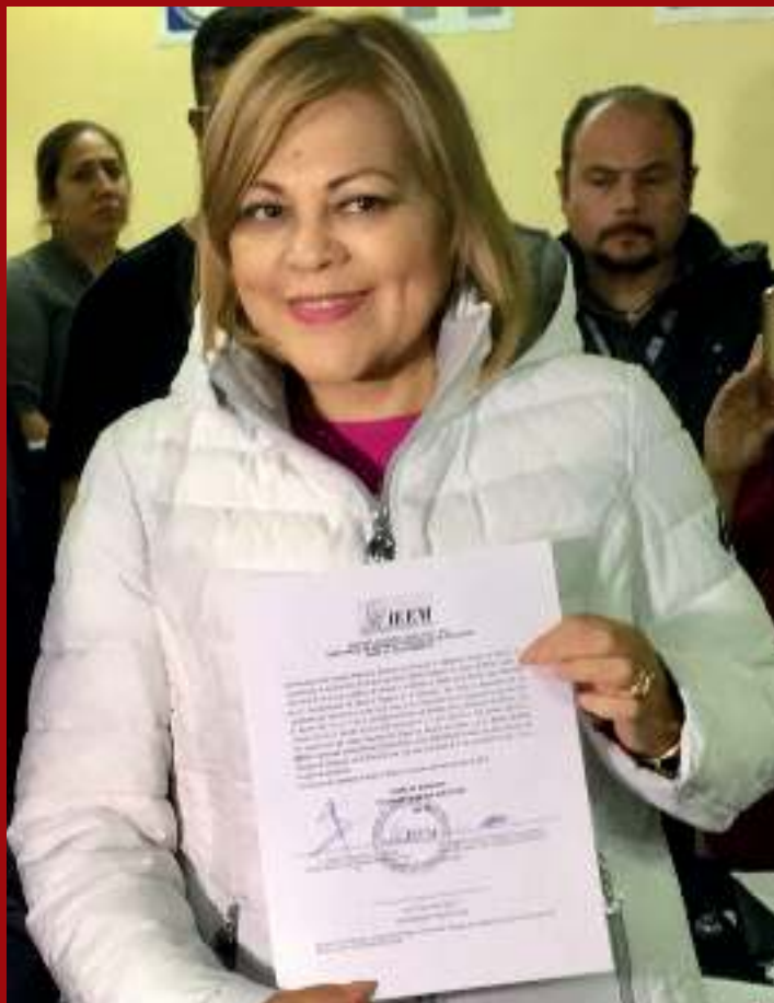
En dicho acto también recibieron su constancia quienes conformarán el Cabildo la Administración 2019-2021.

La ganadora llegó acompañada por los miembros de su Planilla al Ayuntamiento a la junta municipal electoral, para recibir mencionado documento. Ante este acontecimiento sus compañeros y compañeras dieron muestras de júbilo, comprometiéndose a trabajar en equipo con quien llevará la batuta en el H. Ayuntamiento de Atizapán de Zaragoza.