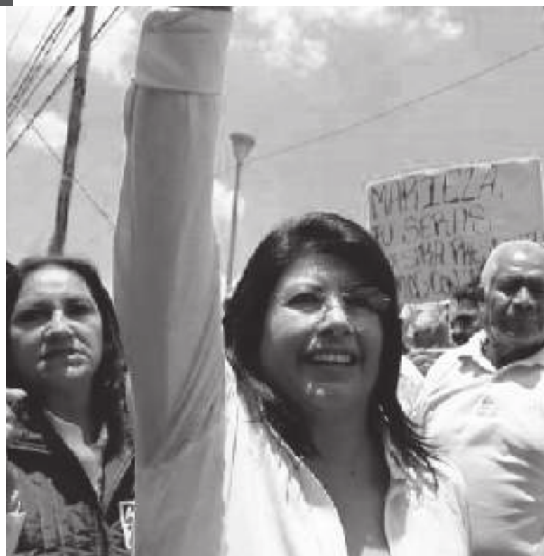
La candidata de la coalición “Juntos Haremos Historia” indicó que en Tecámac inicia una nueva etapa de moralidad.

La alcaldesa electa señaló que su principal compromiso es hacer de Tecámac un lugar seguro, “esta será la última elección que se mueva a través de despensas, de dádivas, de corrupción; mi compromiso es que nuestro municipio va a cambiar, vamos a pacificarlo, a regresar el Tecámac tranquilo, seguro y en paz que todos deseamos”.